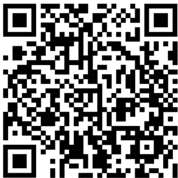
海嘯計畫 S1 活動報名表